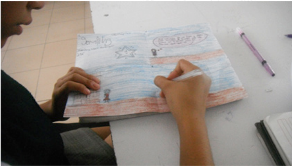
Disfrutando de su trabajo. 2º grado de secundaria.