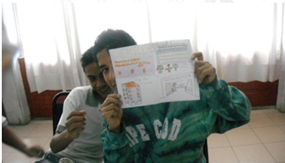
Historieta. 3 er grado de secundaria.

NOTA: Las fotografías fueron tomadas en la Biblioteca de la Secundaria General número 285 "Xipe Totec", dependiente de la Secretaría de Educación Pública, en la Delegación Gustavo A. Madero. I-NGB