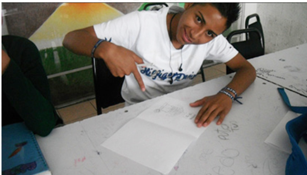
Autor-retrato. 3 er grado de secundaria.