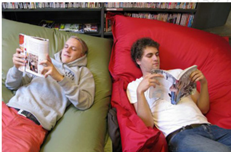
“Dos jóvenes leen recostados en la Biblioteca 10, en Helsinki (Finlandia)”.

La nota ofrece, además, algunos datos interesantes acerca del mundo de las bibliotecas, como que Finlandia es un país de lectores pues tiene unos 5,5 millones de habitantes y una biblioteca en cada uno de sus municipios. En Helsinki, por otra parte, existen 36 bibliotecas para una población de cerca de 600 mil personas. En Estados Unidos hay alrededor de 9 mil bibliotecas públicas (o hasta 119 mil si se toman en cuenta las académicas, escolares, gubernamentales y militares) para atender una población de 319 millones de habitantes. Alemania, en cambio, tiene cerca de 82 millones de habitantes y 7875 bibliotecas públicas. Y finalmente, España, que para una población de 46 millones aproximadamente, tiene 4771 bibliotecas públicas (53 estatales, 70 autónomas y las restantes municipales).