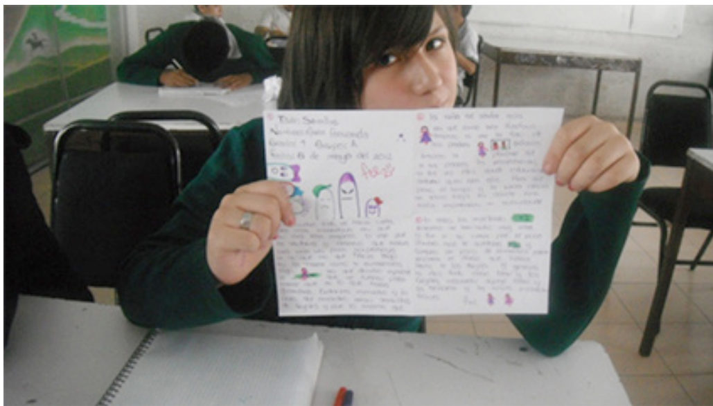
Historieta. 1 er grado de secundaria.