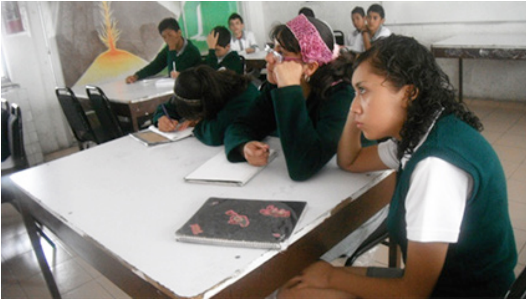
Escuchando la lectura. 2º grado de secundaria.