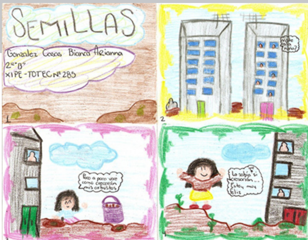
Historieta. 2º grado de secundaria.